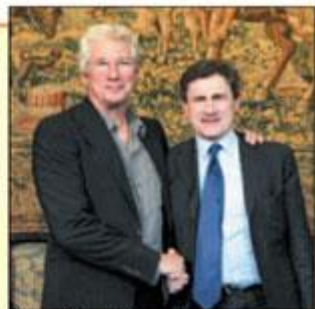
Richard Gere e Gianni Alemanno